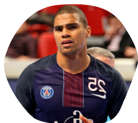
Daniel NARCISSE International de handball