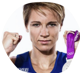
Céline DUMERC Internationale de basket-ball