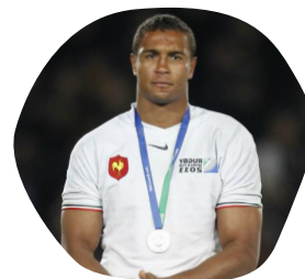
Thierry DUSAUTOIR International de rugby à XV