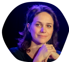
Nathalie PÉCHALAT Internationale de patinage artistique