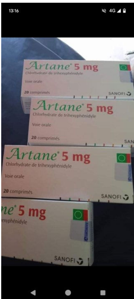
Posts sur un canal privé Facebook, captures d'écran

Enfin, les médicaments, principalement d'Artane® et de Rivotril® ainsi que de Tramadol® sont également proposés à la vente via les réseaux sociaux et applications. Ces ventes de médicaments sont le fait d'opportunités. Les personnes revendent des comprimés ou des flacons après avoir eu une prescription pour elles-mêmes ou pour leur entourage.