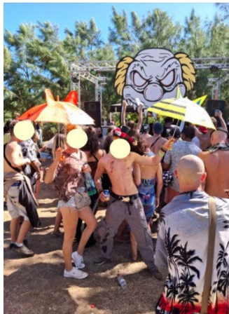
Photo lors d'une free party postée sur un groupe privé Facebook

En 2024, les contrôles de polices à la sortie des bars, des boîtes de nuit mais aussi des free parties se sont multipliés. Sur les réseaux sociaux, les appels de fêtards locaux à une vigilance accrue quant à la possession de produits illégaux ou de consommation d'alcool confirment cette présence policière de plus en plus habituelle.