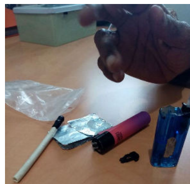
Photos privées de « pipes à crack »